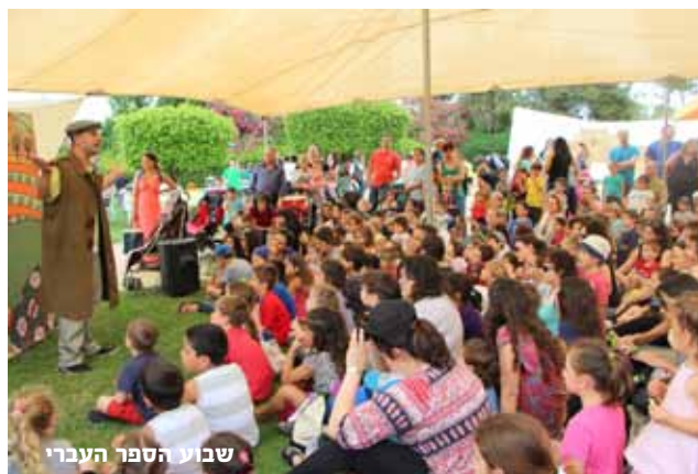
שבוע הספר העברי