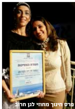
פרס חינוך מחוזי לגן הרוב

◆ מענים משותפים למשפחות / ילדים הזקוקים לשירותים רחבים הכוללים את מחלקת החינוך והמחלקה לשירותים חברתיים בתחום הלימודי - רגשי - חברתי.